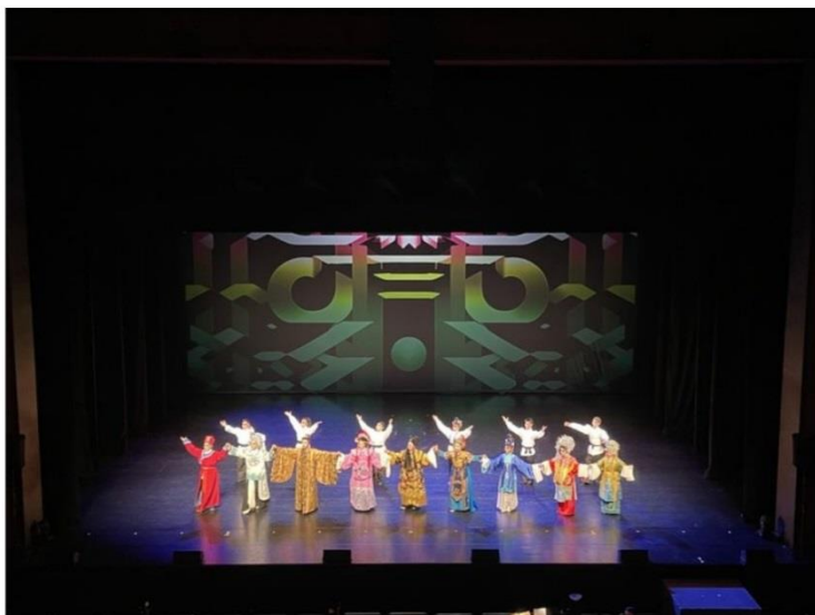
【幻蘊迷宮】全體演員謝幕

搭配流暢的敘事與肢體、唱腔的演繹，讓原本就很優秀的歌仔戲表演，在導演與劇本的指引下，排列成一座看似繁雜的幻象迷宮。不過，隨著劇情推陳，則會豁然發現：移動的不只是人，還有迷宮。