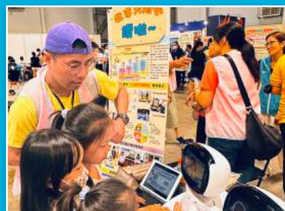
資優班於臺北市教育博覽會設攤發表