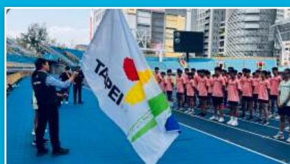
本校主責北市田徑代表隊組訓工作