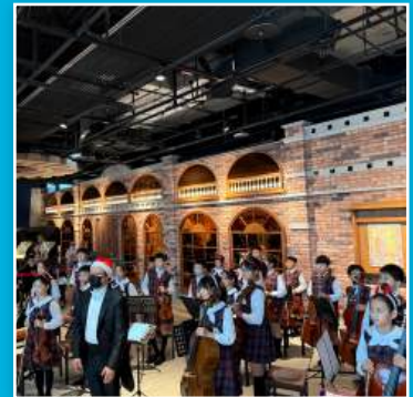
弦樂團赴機場公演