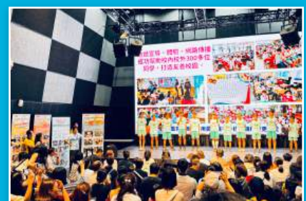
資優班於臺北流行音樂 中心發表