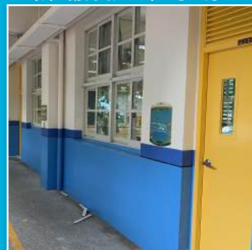
普通班優質化工程