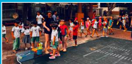
幼兒園畢業闖關活動