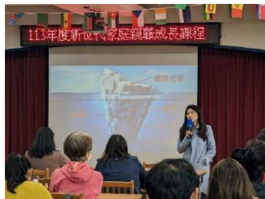
預防網路成癮親職講座

網羅專家蒞校，辦理家長團體成長工作坊、正向教養、避免網路成癮等親職講座，提供家長或實際照顧者相關親職教育，協助爸媽擴充親職角色的不同視角，更有自信陪伴和帶領孩子成長。