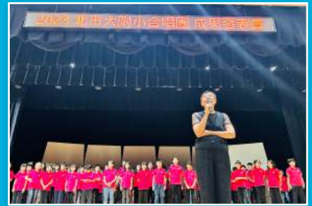
合唱團年度精彩的發表會