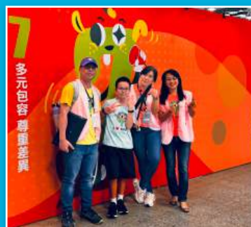
資優班於臺北市教育博覽會設攤發表