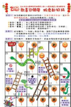
蛇麼都好玩活動卡

輔導室規劃歡欣與溫馨的活動，藉以陶冶孩子的性情，本學期預計辦理活動如：開學日蛇麼都好玩活動、大手牽小手闖關活動、慶祝母親節系列活動……等，以有意義的互動內容，給予孩子更多正面經驗和能量。