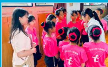
跳繩隊榮獲傳統藝術特優