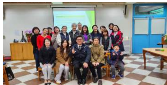
EQ 課程志工期末會議