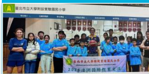
本校師生赴澳洲進行國際交流