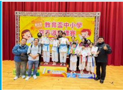
本校學生參加空手道 競賽為校爭光