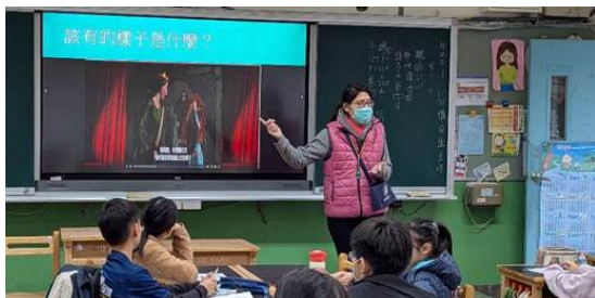
SEL 情緒教育電影賞析