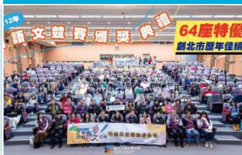
教師及學生於國語文競賽為校爭光