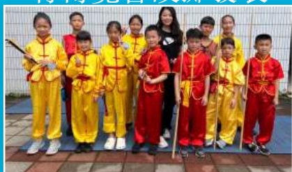
本校學生參加武術競賽為校爭光