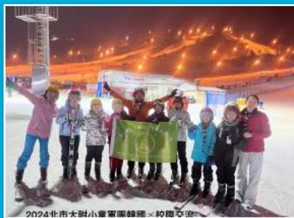
童軍團赴韓國交流