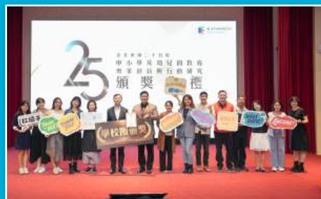
本校教師榮獲創新實驗與 行動研究團體第一