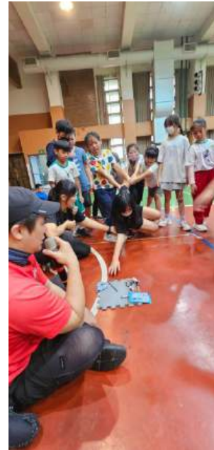
班級團體動力活動

1. 推動社會情緒學習（SEL）教育，申請教育局經費購買元素方程式等 5 部線上影片的公播版權，供教師透過吸引學生的素材，探討影片中的情緒議題。2. 邀請家長志工團體入班推動 EQ 課程，以有系統的教材幫助班級認識情緒，管理情緒。3. 透過校內專、兼輔老師以及外聘的專業心理師進行團體輔導、個別輔導，協助孩子覺察自己的狀態，有力量和策略成為更好的自己。