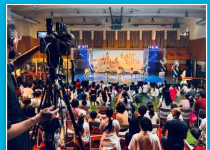
年度社團展演活動盛況