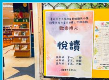
兒童月上下課翻轉活動