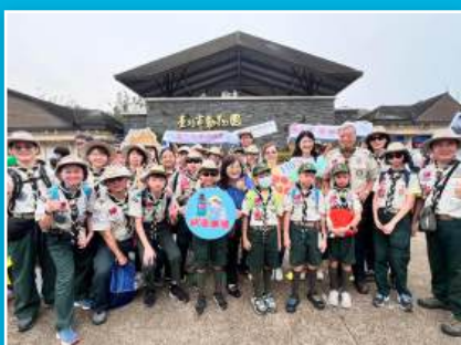
童軍團參加臺北市童軍大會