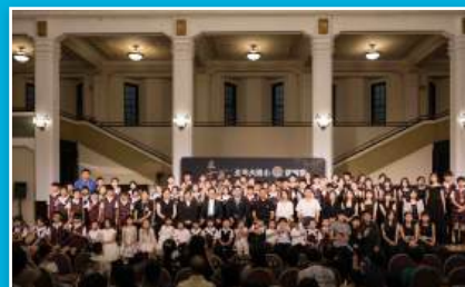
弦樂團年度精彩的發表會