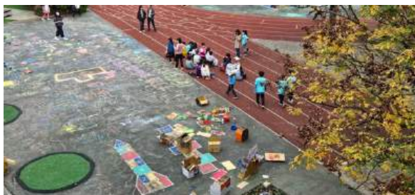
資優班 DFC 課程-校園遊戲日

網路世代的社群媒體，改變了人的互動方式，並且以龐大利益的商業模式主動餵養使用者感興趣的議題，窄化使用者的選擇性，學習者面對著各種思辨能力的挑戰及其衍生的心理議題，輔導室以專業能力和實際作為，願陪伴親師生一起走過。