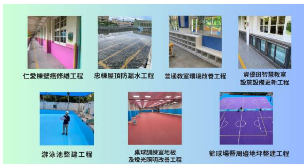
本校 113 年七項校園修建工程照