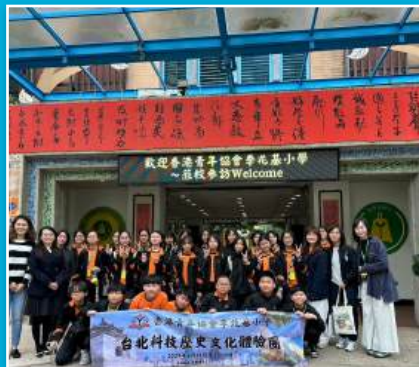
香港李兆基小學蒞校交流