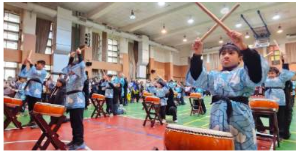
特教班校慶太鼓表演

本學年度特教班在行政單位募款、教師積極投入以及特教家長聯誼會出資外聘偕同教師下，成立融入音樂課程的太鼓隊，推動音樂療癒課程；潛能班亦持續推動知動課程和適應體育課程，協助學生學習團隊互動技巧和肢體動覺；資優班的DFC(Design for change)課程，則培養學生具有實踐的能力，將所學運用在生活情境中，學習問題解決與分享，成為關懷社會，具有優秀公民素養的人才。