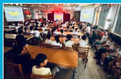
兒童月上下課翻轉活動