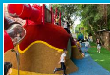
115年將於校內新設 遊戲場