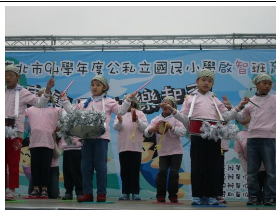
94 學年台北市特教班育樂營活動