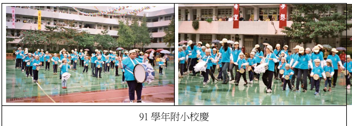
表一 打擊樂演出相片