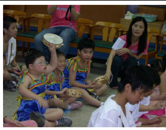
94 學年特教班畢業歡送會