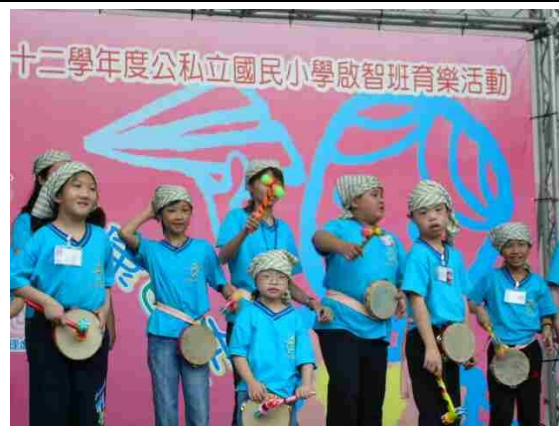
92 學年台北市特教班育樂營活動