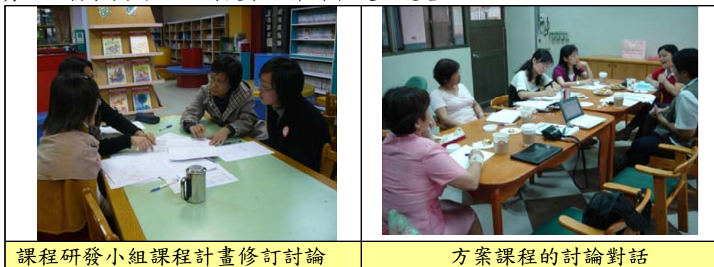
課程研發小組課程計畫修訂討論

本方案課程從醞釀規劃、試作、實作期後，透過摸索、探討、改進中，逐漸朝向穩定發展中，並期望隨著教育政策與潮流的與時俱進及外在環境、時勢的變化，更思力求適切性、合宜性、周延性與永續性；方案課程評鑑也從內部評鑑又加上邀請了師資培育機構教授參與指導，進行了外部評鑑；所有的計畫、實施成果、審查評鑑意見都建置成網路，希望能鑑往知來。因而透過下列期程，執行課程的規劃設計、實施、發表與評鑑，期使本方案課程更加完善。