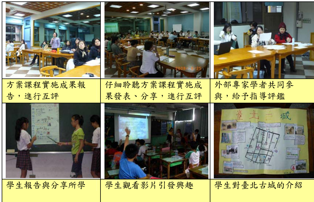
圖 4 「走進臺北城」課程方案執行甘梯圖